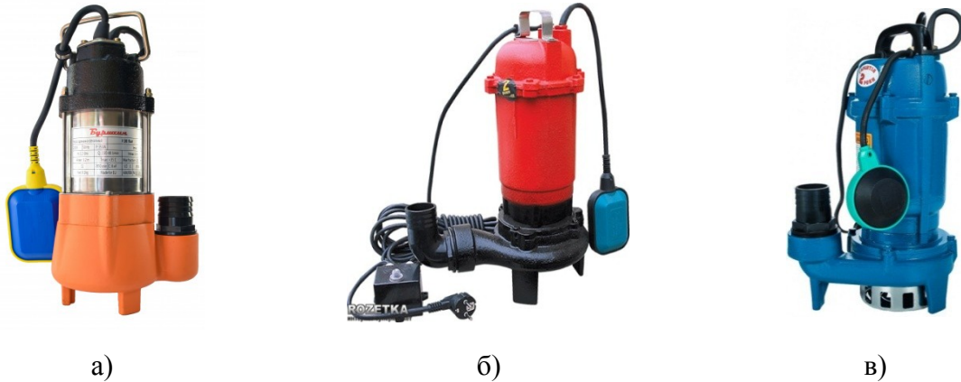
Рисунок 2 – Загальний вигляд дренажно-фекальних насосів: а) Бурштин V 180 F; б) Optima WQ10-12G; в) Vitals Aqua KC.

Приклад оперативного розгортання адаптованого дренажно-фекального насосу для цілей пожежогасіння показано на рис. 3.